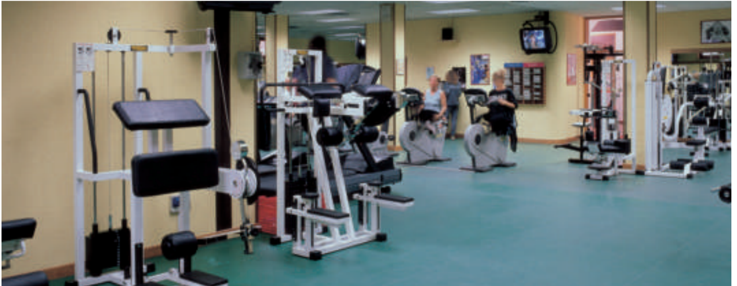
Rivestimento controsoffitto Palestra BodyBuilding

degli arredi, hanno contribuito altresì a “riscaldare” la grande sala, rendendola più piacevole anche a livello estetico.