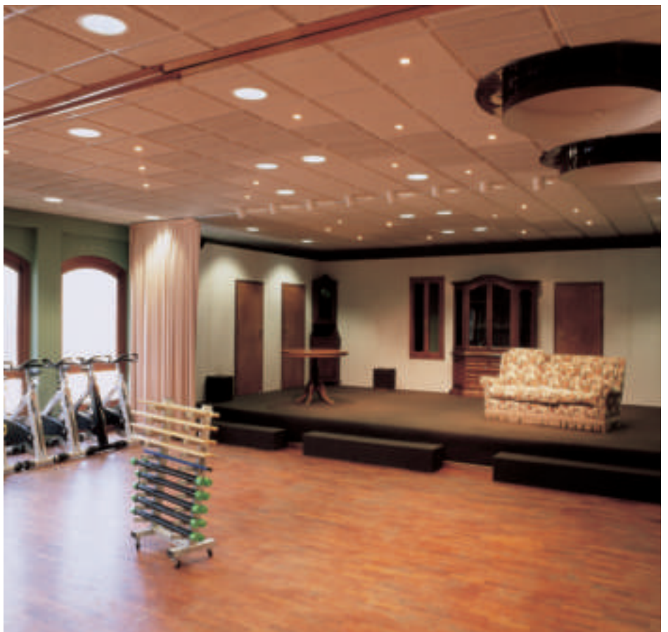
Rivestimento controsoffitto Palestra - Teatro

riduzione della dispersione termica". Con un tocco di gradevolezza estetica: i pannelli Kontro, in tonalità grigio chiaro, hanno conferito all'ambiente nuova luminosità ed eleganza.