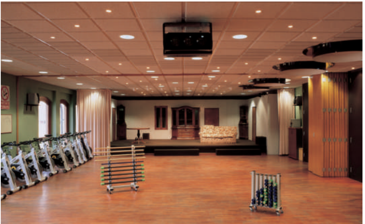
Rivestimento controsoffitto Palestra - Teatro

Di qui, risaliamo fino all’immensa, originale mansarda, adibita a sala giochi, in particolare al bridge. Un ambiente particolarissimo, a forma piramidale, ottimamente illuminato: grandi travature salgono verso un centrotetto riquadrato, dotato di quattro grandi lucernari sferici, cui si accompagnano, nella parte inferiore, eleganti finestre.