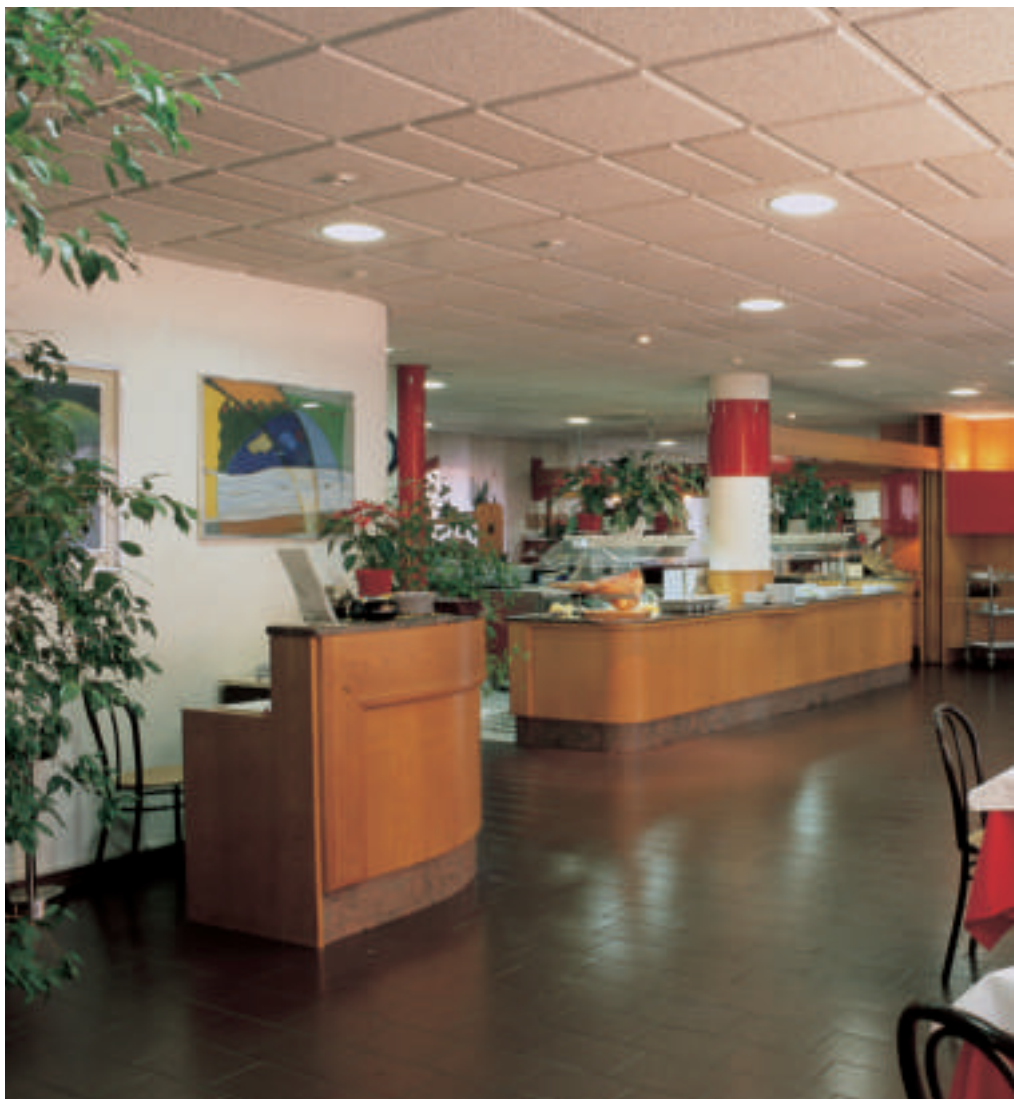
Rivestimento controsoffitto sala Ristorante