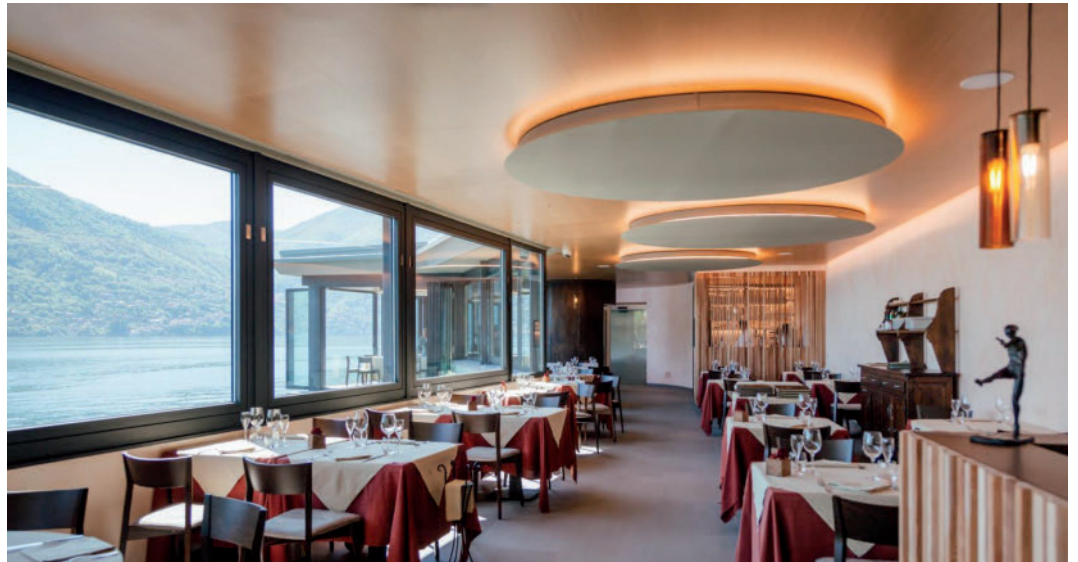
Ristorante Crotto dei Platani Brienno Lago di Como

Dispone di strumenti e tecnologie di ultima generazione, utilizzabili sia in fase di progettazione che d'intervento.