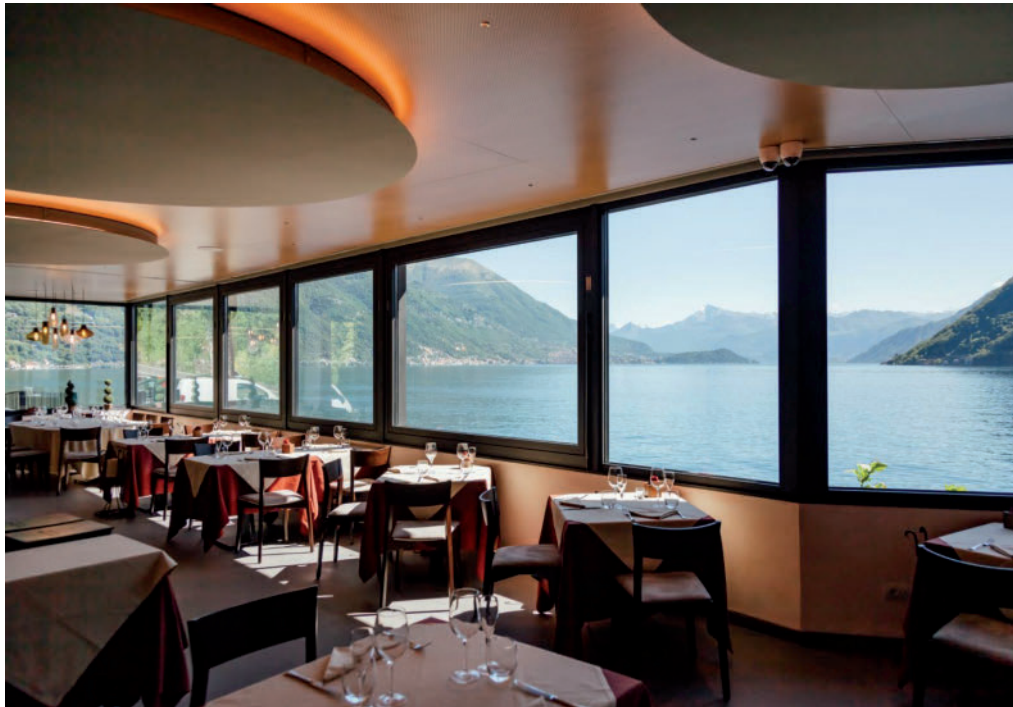
Ristorante Crotto dei Platani Brienno Lago di Como