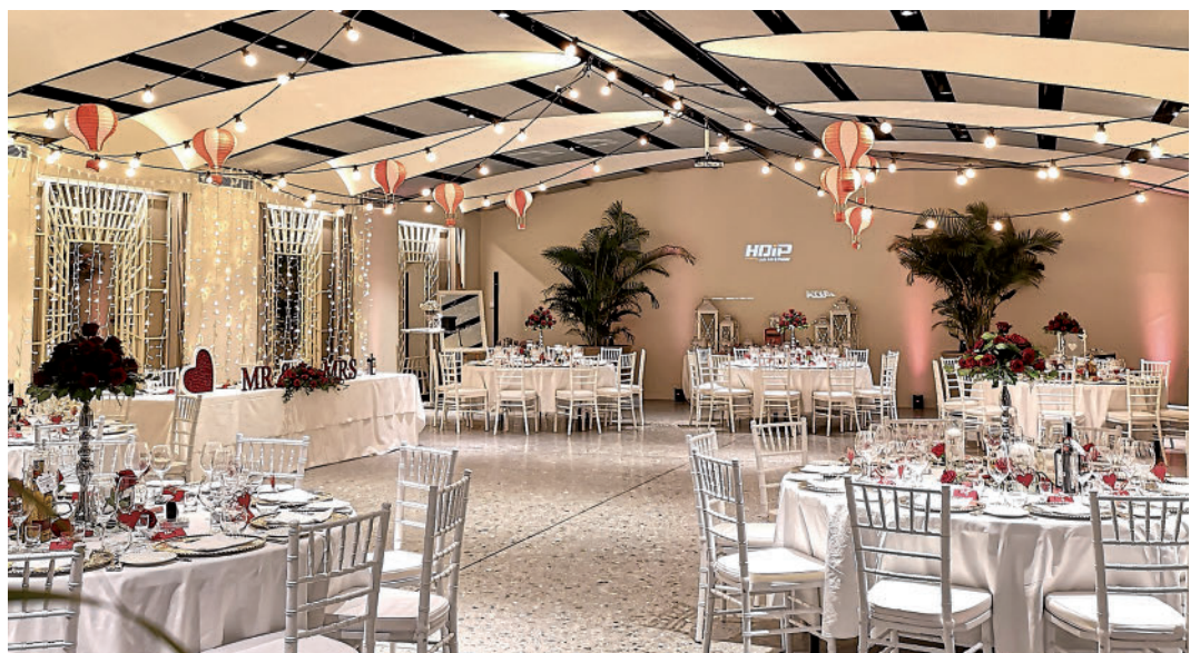
Sala ricevimenti del Grand Hotel Tremezzo sul Lago di Como

L'esperienza, la passione e i numerosi interventi eseguiti costituiscono la nostra migliore garanzia.